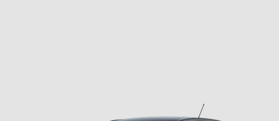
Gris Grafito Metálico